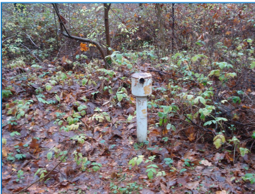
Attēls 39. Novērošanas urbums Nr. 3134