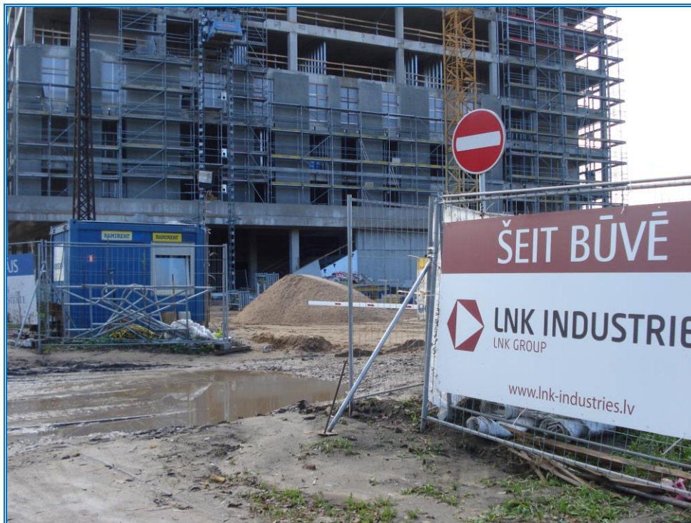
Attēls 19. Būvlaukuma Torņakalna dārziņos fragments