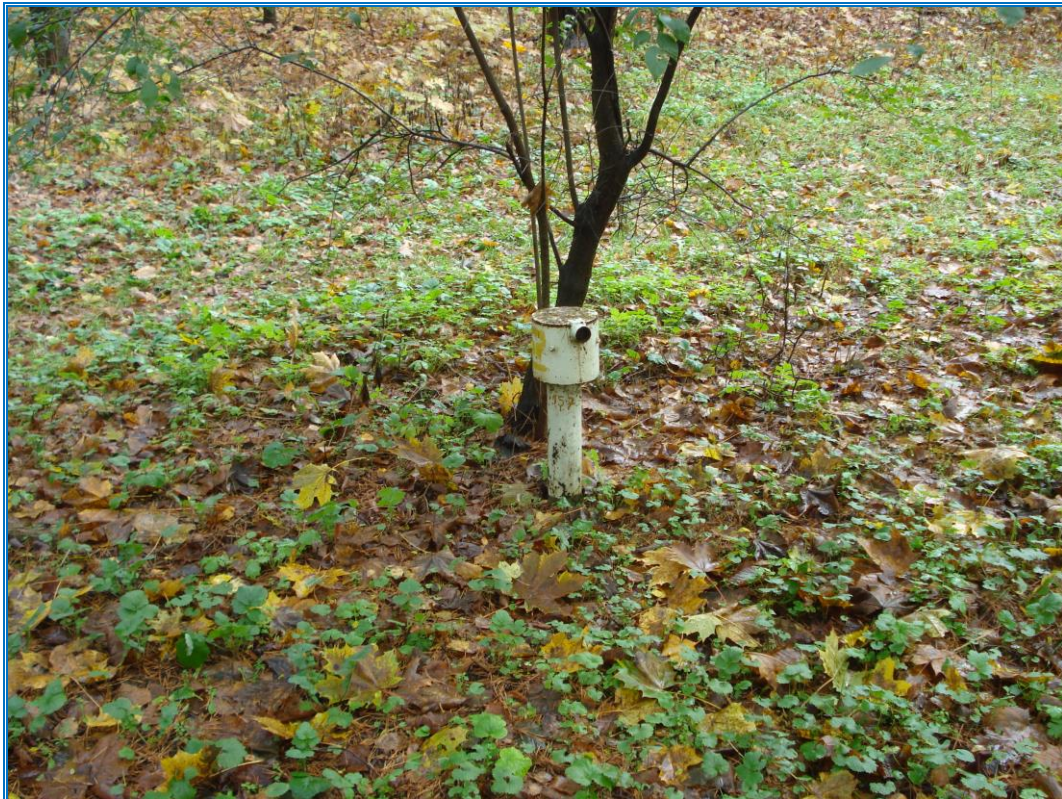
Attēls 36. Novērošanas urbums Nr. 3133