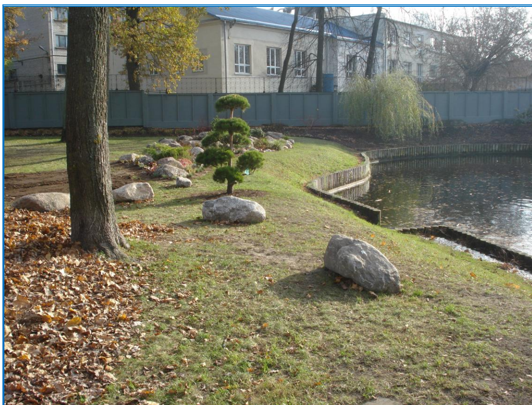
Attēls 26. Kobes parka fragments kādreizējā urbuma Nr. 3213 atrašanās vietā