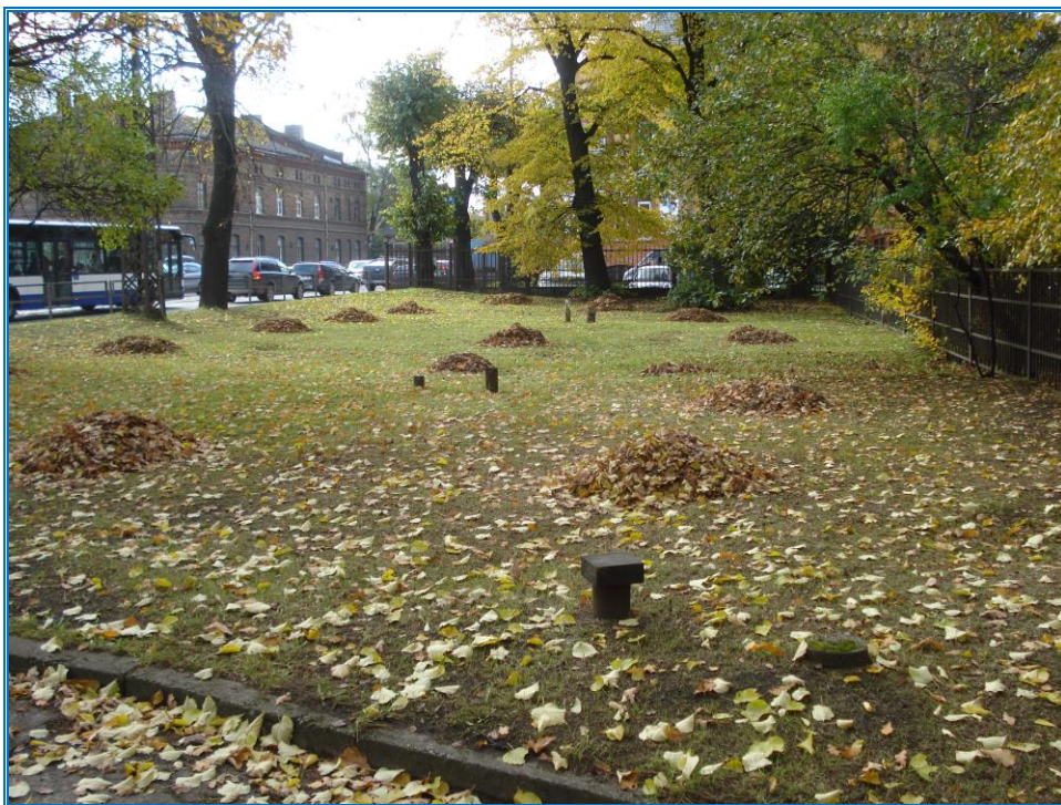
Attēls 13. Urbumu Uzvaras bulvārī detaļas