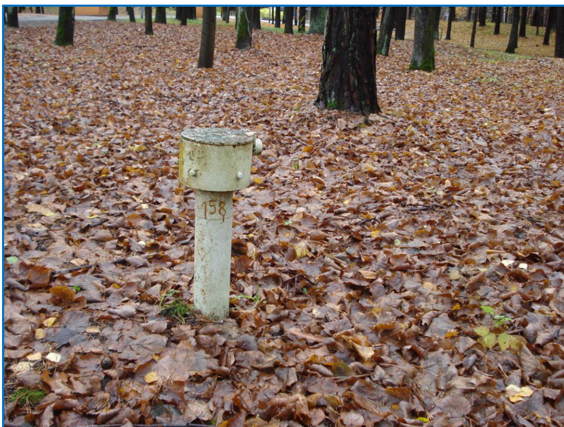
Attēls 38. Novērošanas urbums Nr. 3136